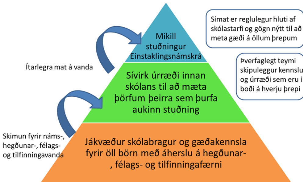
Mynd 1: Þrepaskiptur stuðningur í skólastarfi

Fræðimenn leggja áherslu á að geðrækt, forvarnir og snemmtæk íhlutun í skólum sé skipulögð í formi þrepaskipts stuðnings (e. multi-tiered systems of support) sem nær jafnt til námslegra þátta, hegðunar og félags- og tilfinningafærni (Elias o.fl., 2015; Stephan, Sugai, Lever og Connors, 2015; McIntosh og Goodman, 2016). Þar liggja jákvætt skólaumhverfi, góður skólabragur og jákvæð tengsl við skóla til grundvallar öllu starfi skólans og áhersla lögð á markvissa kennslu og þjálfun í félags- og tilfinningafærni fyrir alla nemendur (sjá mynd 1). Til viðbótar séu sívirk og snemmtæk úrræði til staðar til að mæta þörfum nemenda sem þurfa aukna aðstoð á sviði náms, hegðunar, tilfinninga- eða félagsfærni auk stuðnings við þau sem þurfa mikinn eða fjölþættari stuðning til lengri tíma. Um er að ræða heildstætt skipulag kennslu, starfshátta og stuðningsúrræða í skólum til að tryggja með sem bestum hætti að öll börn hafi jöfn tækifæri til að blómstra í námi.